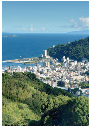
居室から見える風景