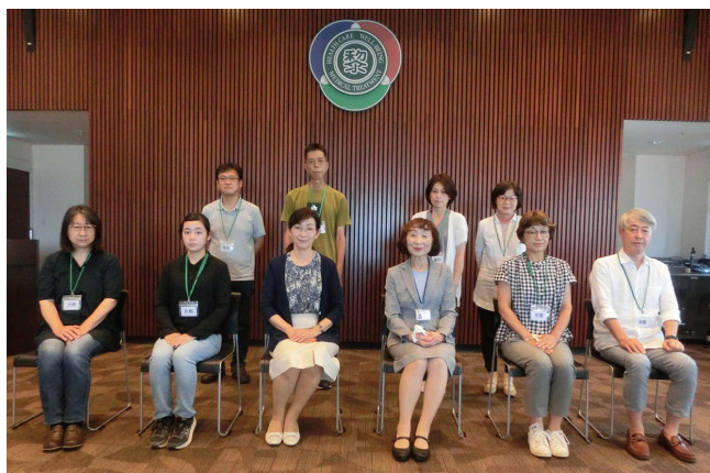
令和5年度 介護福祉士実務者研修 7月生

研修で学んだ利用者様の思い、利用者様中心とする個別支援を意識し、根拠に基づいた介護サービスを提供できるように心掛け、利用者様が笑顔で安心できるように存在になりたいです。短い期間でしたが、ありがとうございました。