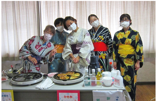
4階夏祭り お好み焼き